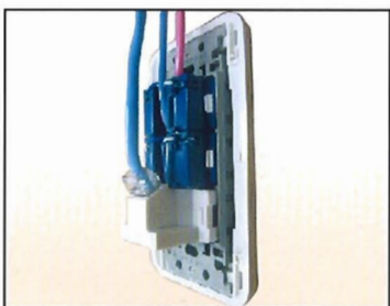
情報コンセント背面